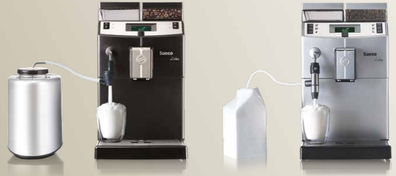
Cappuccinatore Thunder y Siluro Lirika

Cappuccinatore Thunder y cappuccinatore Siluro (acero inox) se colocan en la lanza de vapor para erogar cremosos cappuccinos y bebidas a base de leche fresca. Se puede combinar también con el Milk Cooler.