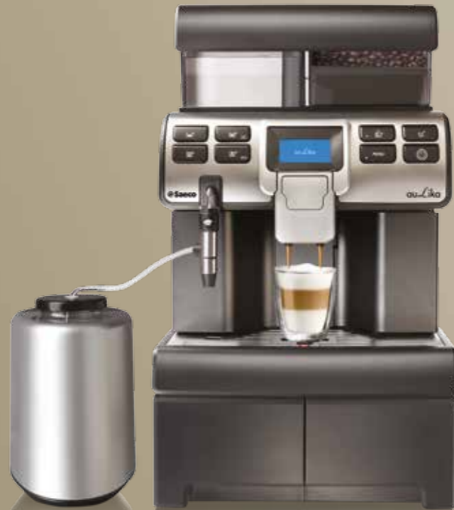
Base Aulika Mid

Metal pintado en negro mate y ABS, dispuesto en family feeling con Aulika Mid, con 2 cajones para bolsas de azúcar, paletinas, etc. Se recomienda la combinación con la máquina si se utiliza el refrigerador Astra o el Milk Cooler.