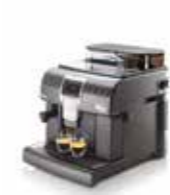
Royal Gran Crema