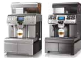
Aulika Top / Top RH