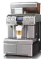
Aulika Top / Top RH High Speed Cappuccino